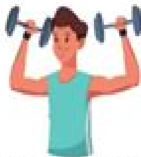
Entrenamientos de fuerza