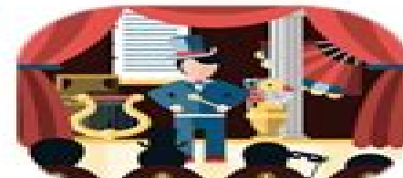
ir al teatro