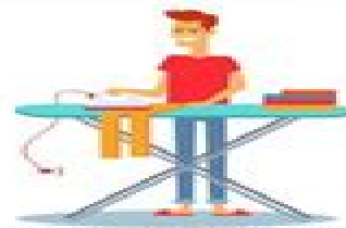
planchar la ropa