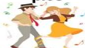
ir a bailar