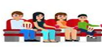
ir al cine