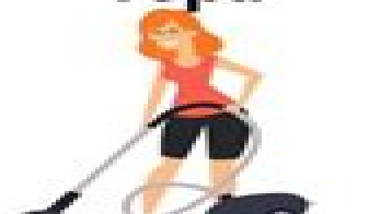
pasar la aspiradora