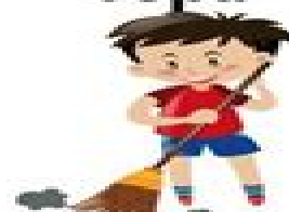
barrer el piso