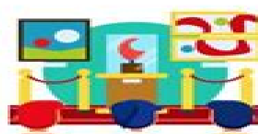
ir al museo