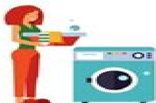
lavar la ropa