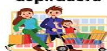
ir de compras