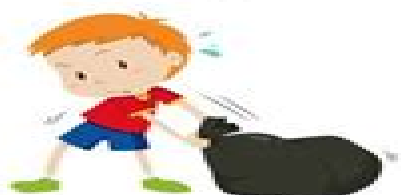
sacar la basura