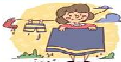
tender la ropa