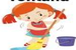
trapear el piso