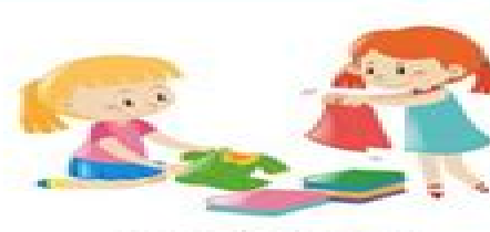
doblar la ropa