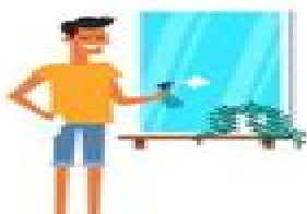
limpiar la ventana